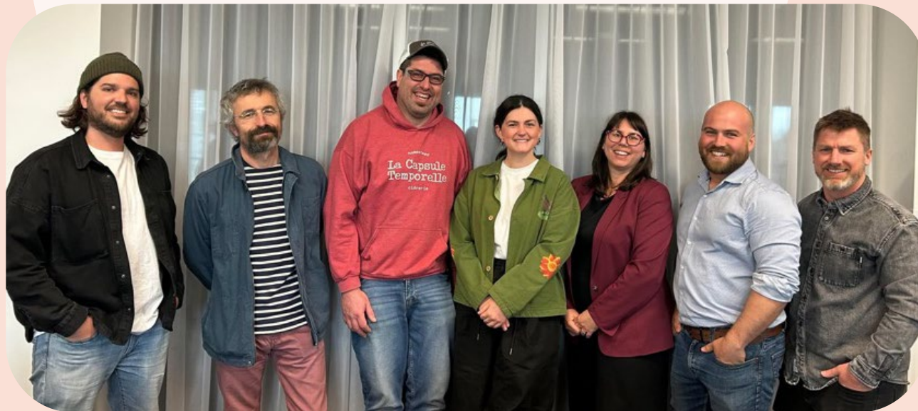
Conseil d'administration 2025-2026

Représenter l'ensemble des producteurs et valoriser le cidre du Québec