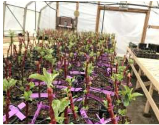
Expérimentation d'un producteur d'ici, des greffes sur table en serre!

Membre Agropomme..... gratuit Non membre Agropomme ..... 15.00 $