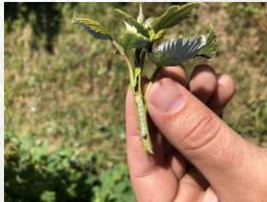
Larve de Hartigia trimaculata retrouvée dans une tige de plant de framboises. Que sait-on sur ce ravageur nouvellement retrouvé dans notre région?