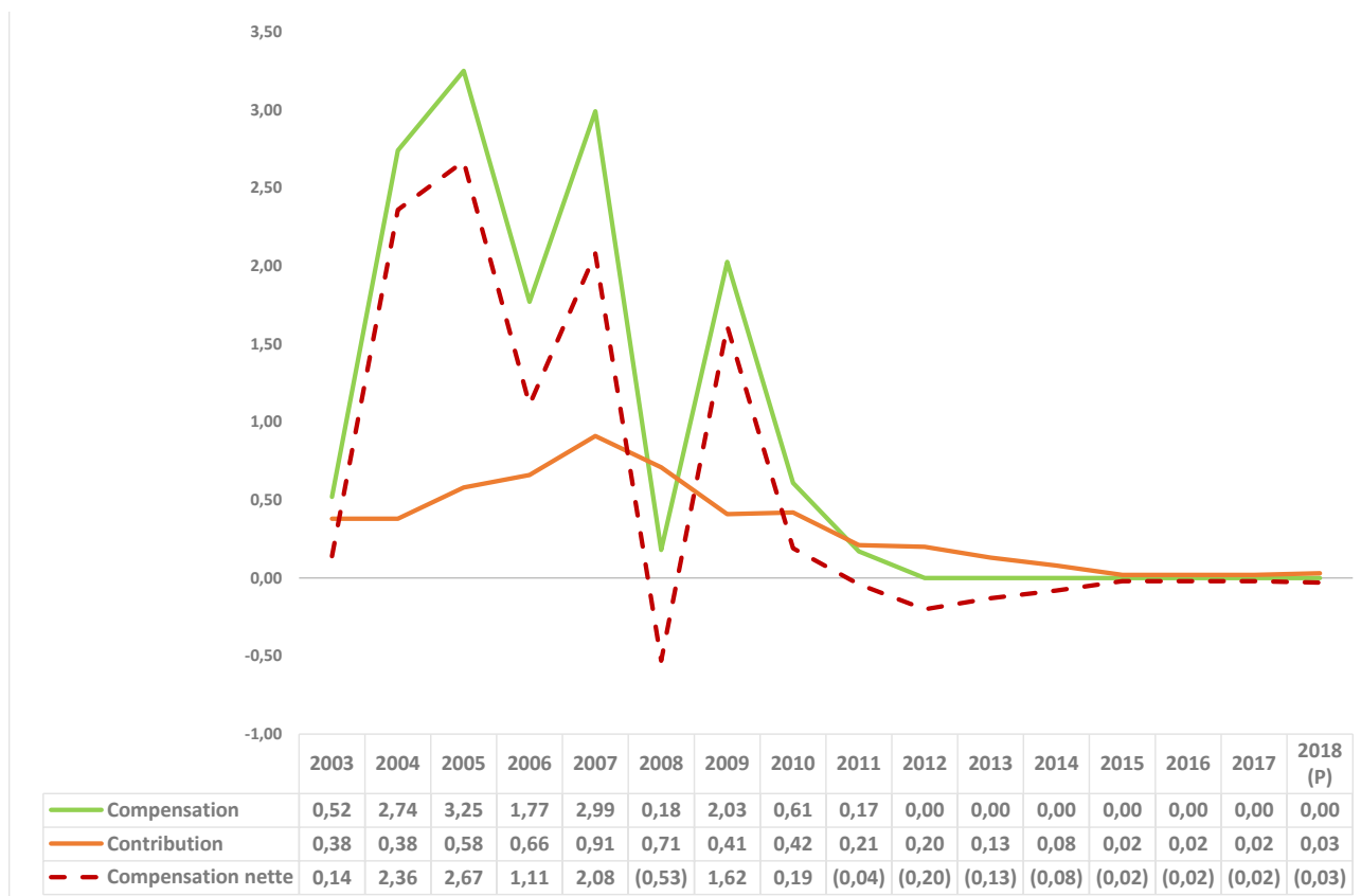
Graphique 3 - Compensation, contribution et compensation nette du secteur pomme au programme ASRA pour les années d'assurance 2003 à 2018 ($ /minot)